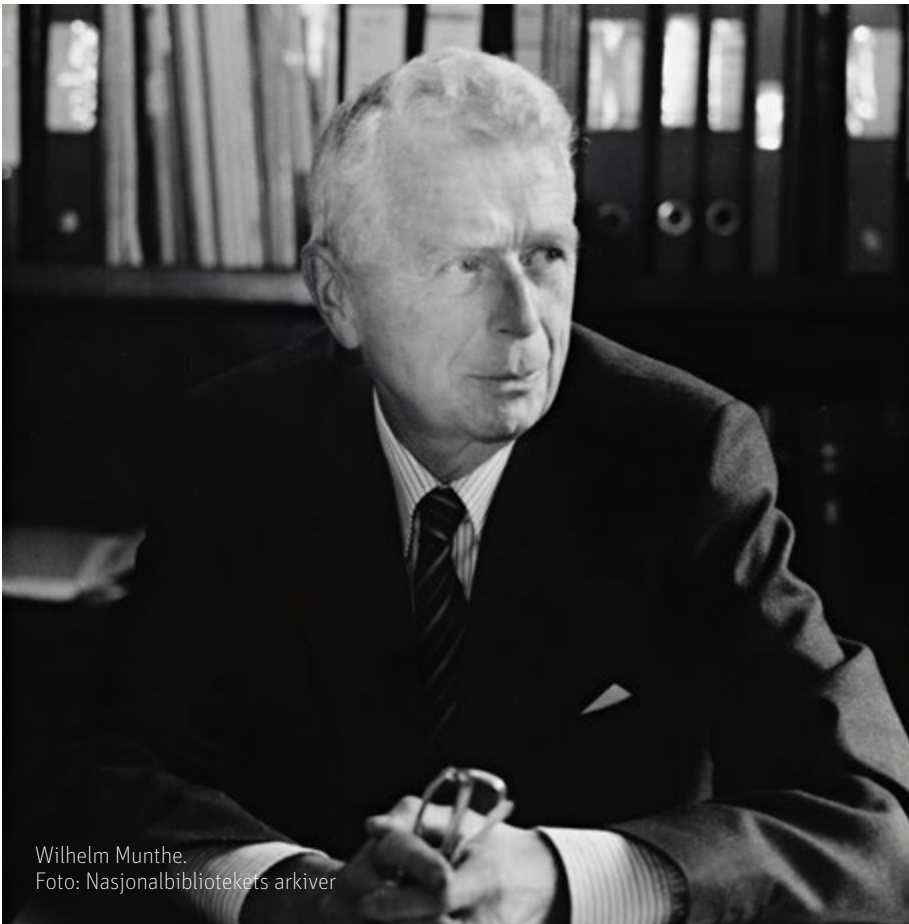
Wilhelm Munthe.

vera eit forskings- og vitskapsbibliotek, men denne saka skapte strid internt på UB, og den vann ikkje gehør i resten av bibliotekmiljøet og Stortinget parkerte den i 1930. Det ser ikkje ut til bibliotekoffentlegheita var særleg opptatt av eit institusjonelt nasjonalbibliotek.